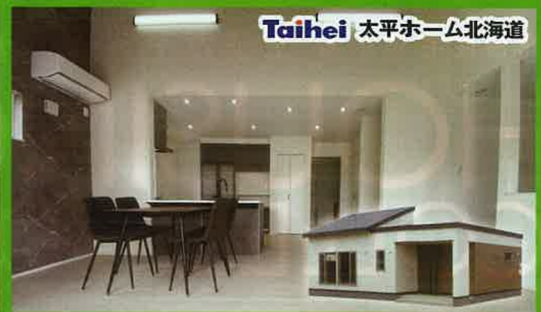
Taihei 太平ホーム北海道