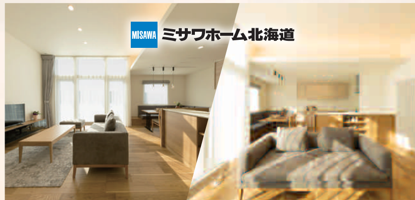
MISAWA ミサワホーム北海道