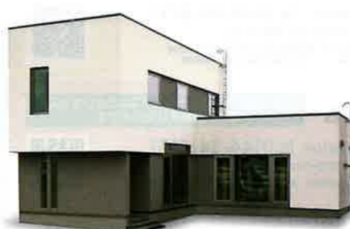
MISAWA ミサワホーム北海道