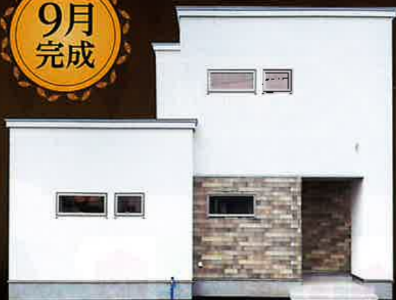
Mirai Home 東開町