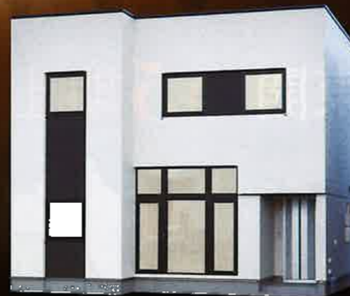
Misawa Home 東開町