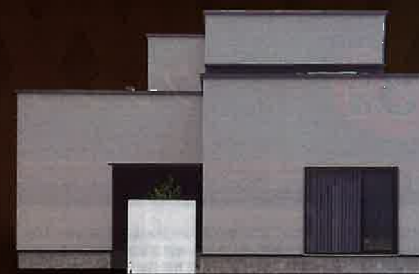
Juken house 拓勇西町