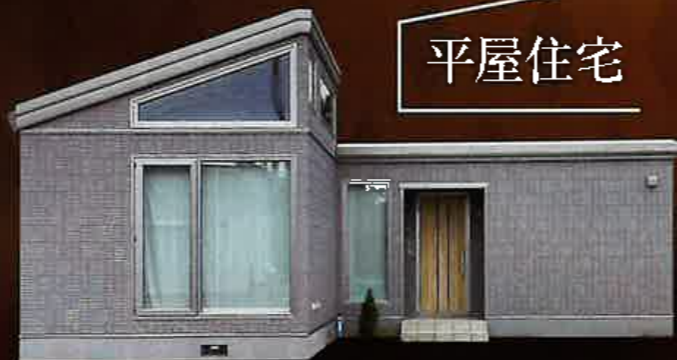
Sekisui Heim 東開町