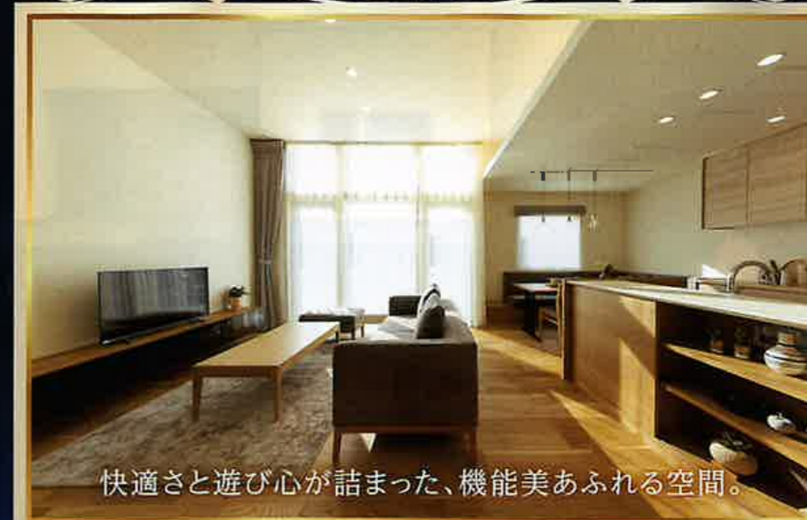
快適さと遊び心が詰まった、機能美あふれる空間。

MISAWA ミサワホーム北海道 苫小牧市清水町1丁目1番10号 TEL.0144-36-0330