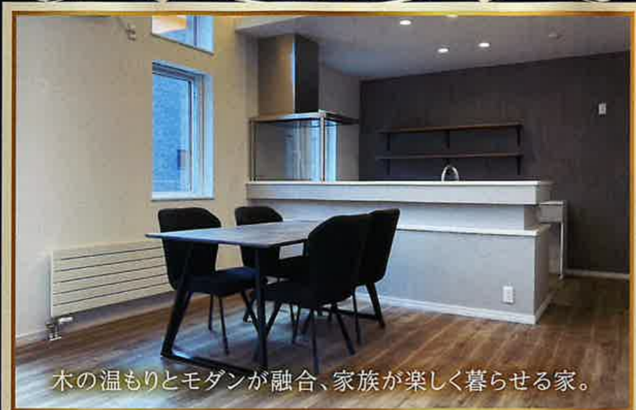
木の温もりとモダンが融合、家族が楽しく暮らせる家。

ミライホーム 苫小牧市有明町2丁目11番15号 TEL.0144-84-8019